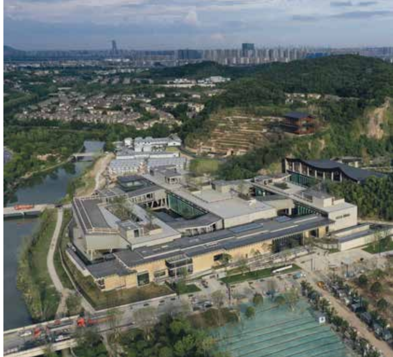
Amateur Architecture Studio – The National Archives of Publications and Culture in Hangzhou