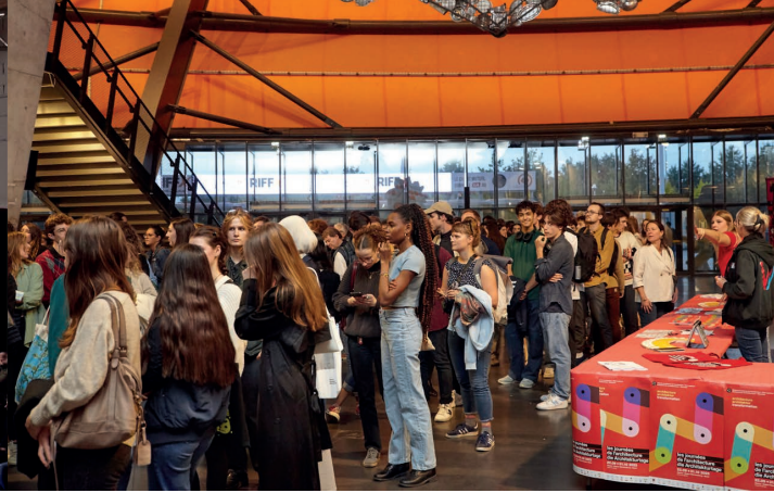
Vortrag von Wang Shu im Zénith Strasbourg, AT 2023