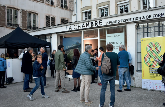
Archifoto 2022 © MEA