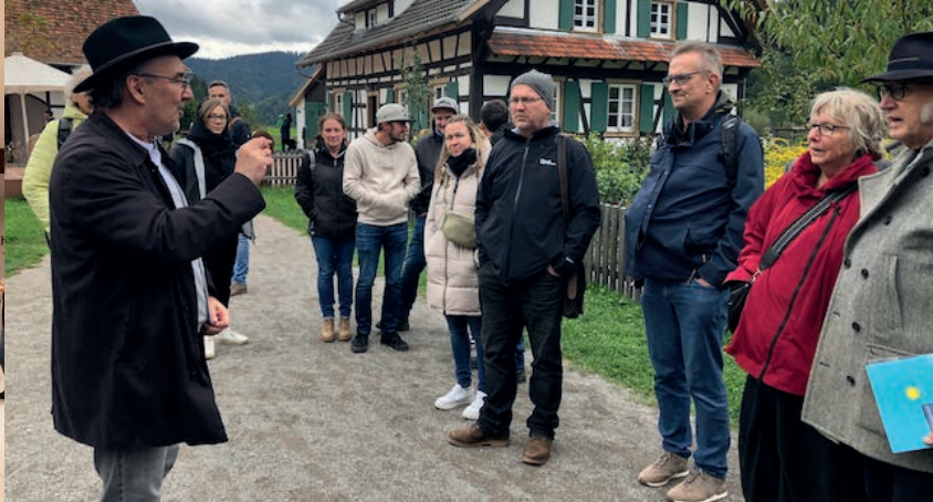
Gutach, AT 2024