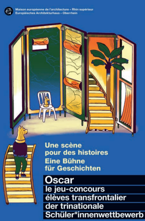
Plakatte des Oscar-Schülerwettbewerb 2025/2026 © Tom Vaillant / Dans les villes