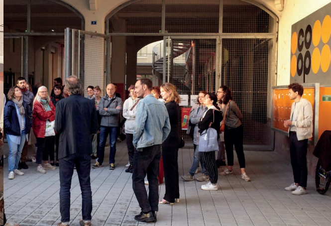
Kaleidoscoop, AT 2023