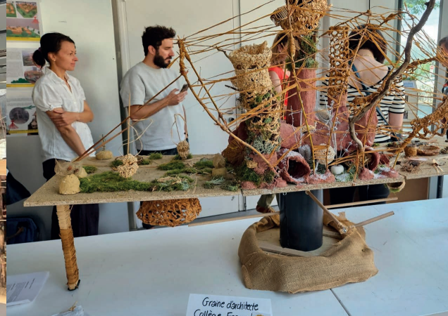
Preisverleihung des Oscar-Schülerwettbewerb 2022/2023 in Strasbourg