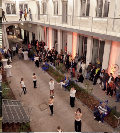
Eröffnungsfeier, AT 2023