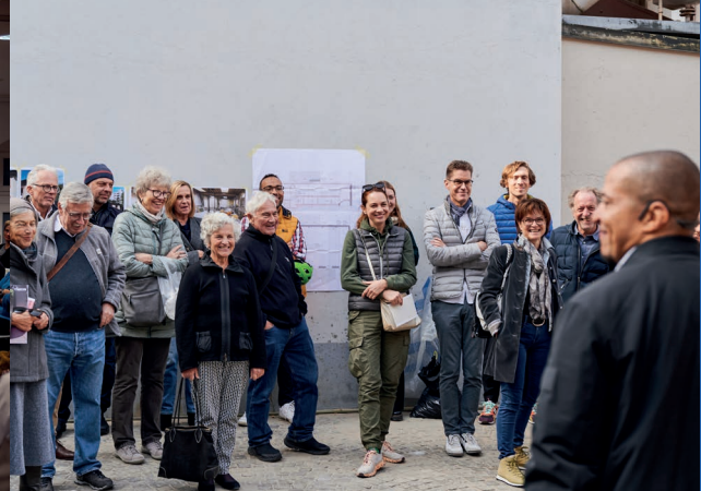
Plakatte des Architekturtages, AT 2025 © Dans les Villes