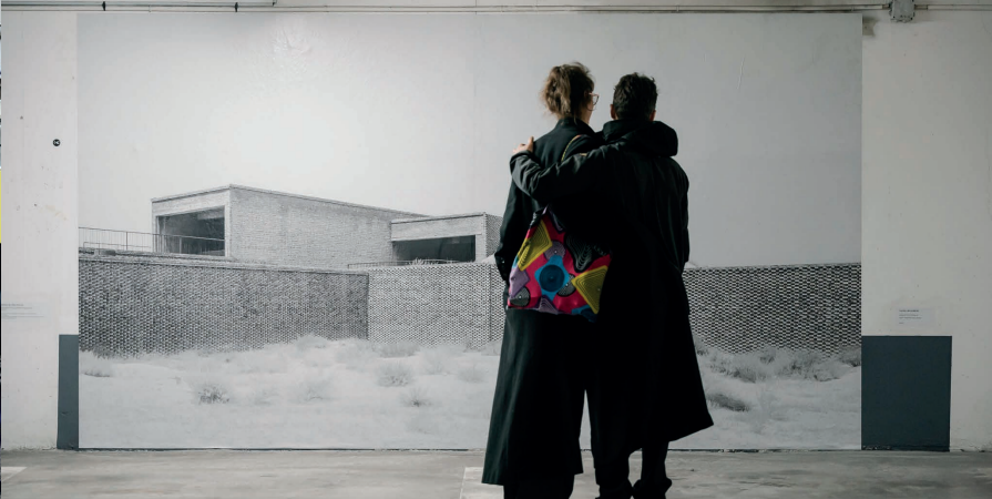
Archifoto 2024 © Alex Flores