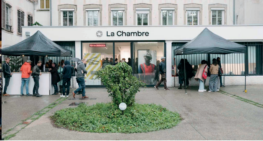
Archifoto 2024 © Alex Flores