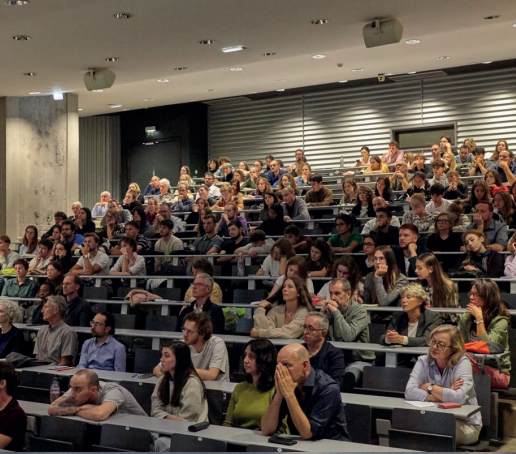
Vortrag von Studiolada in Mulhouse, AT 2023