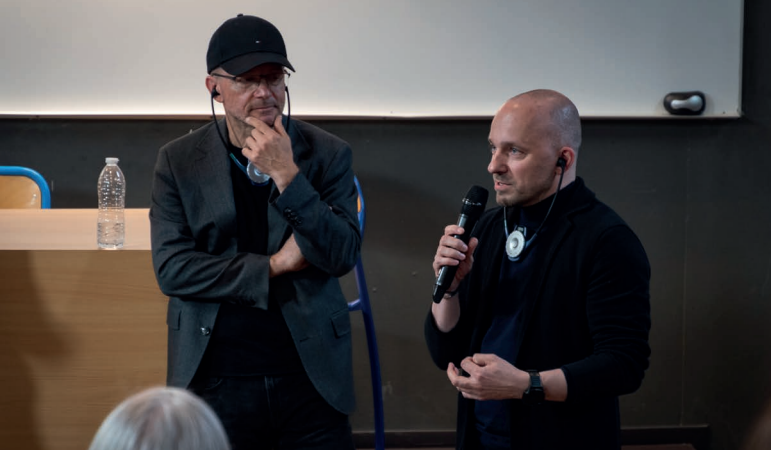
Europäischen Architektur-Begegnungen 2023