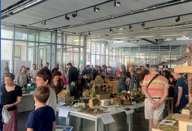
Preisverleihung des Oscar-Schülerwettbewerb 2022/2023 in Strasbourg