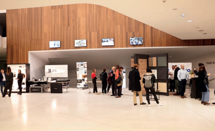
Palais de la Musique et des Congrès in Strasbourg, AT 2024