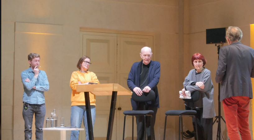
Europäischen Architektur-Begegnungen 2024 © Evan Peronne