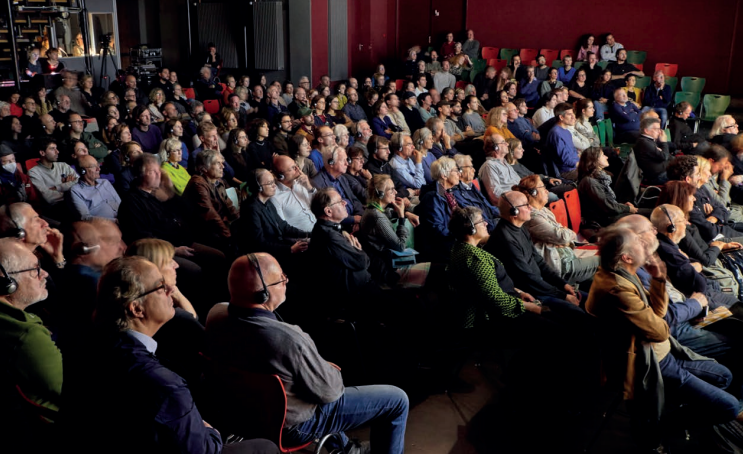
Conférence Amelia Tavella à Karlsruhe, JA 2024