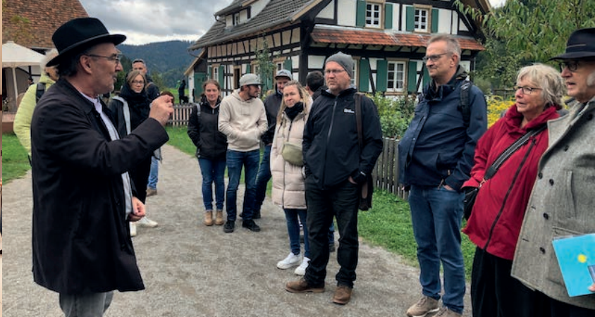
Gutach, JA 2024