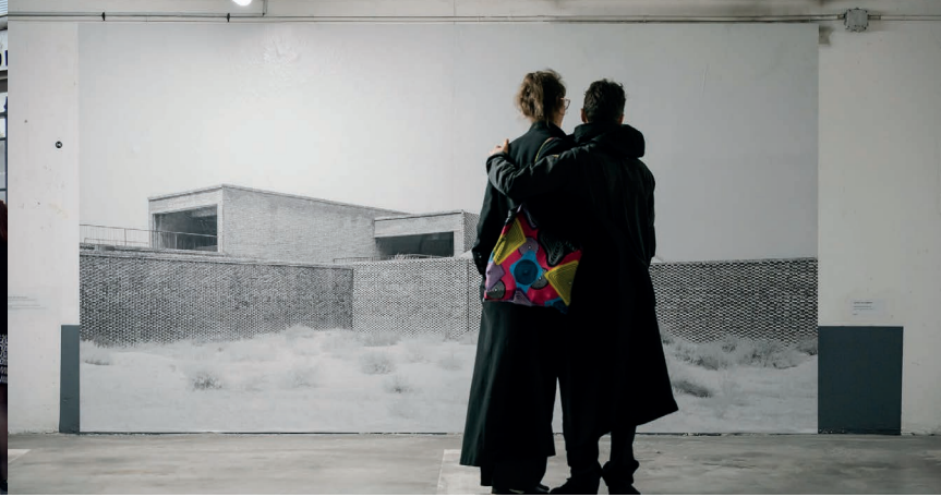
Archifoto 2024 © Alex Flores