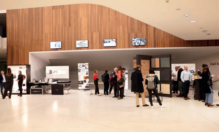
Palais de la Musique et des Congrès de Strasbourg, JA 2024