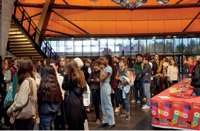
Conférence de Wang Shu au Zénith de Strasbourg, JA 2023