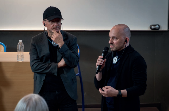
Rencontres européennes de l'architecture 2023