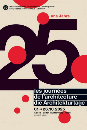
Affiche des Journées de l'architecture 2025 © Dans les Villes