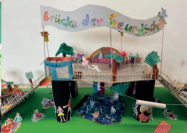
Remise des prix du concours OSCAR 2024/2025 à Freiburg