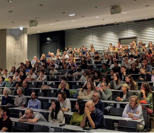
Conférence de Studiolada à Mulhouse, JA 2023