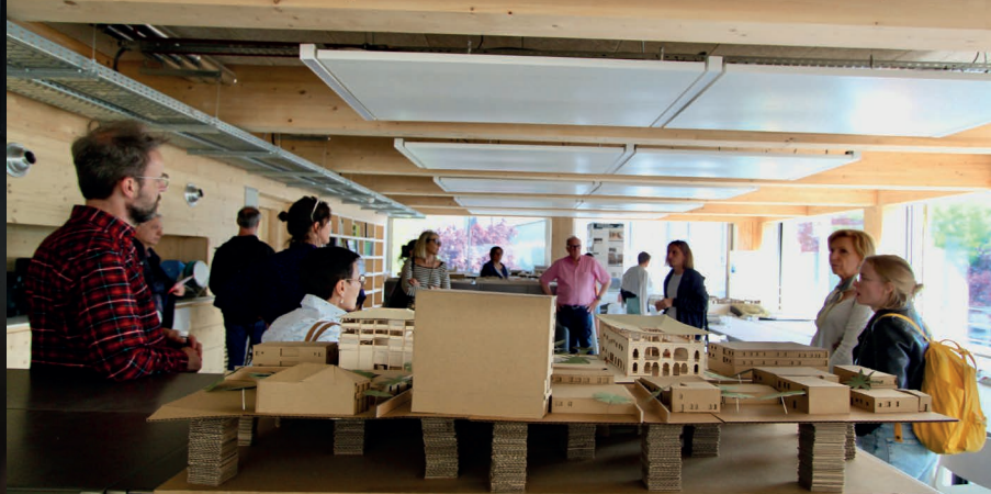
Rencontres européennes de l'architecture 2023