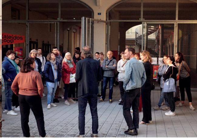
Visite du Kaleidoscoop, JA 2023