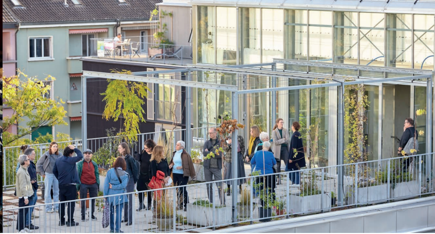
Rencontres transfrontalières 2024