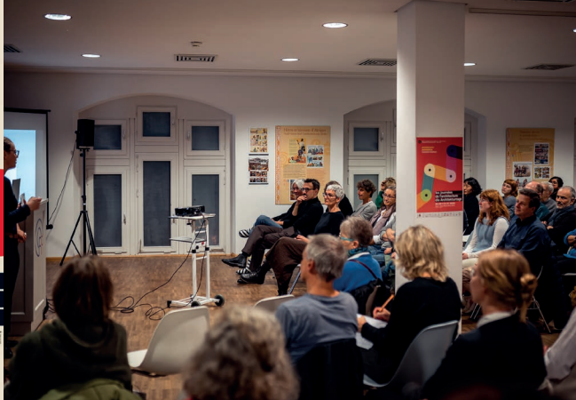
Conférence de Studio Céline Baumann à Freiburg, JA 2023