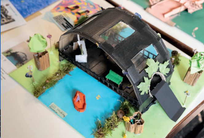
Remise des prix du concours OSCAR 2024/2025 à Heidelberg