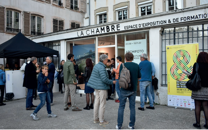
Archifoto 2022